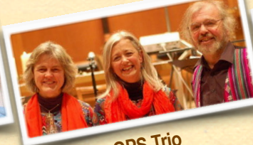
GPS Trio administrateur